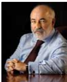
Вексельберг Виктор Феликсович Президент Фонда «Сколково», сопред- седатель совета Фонда

Родился 14 апреля 1957 года в г. Дрогобыче (Украина).