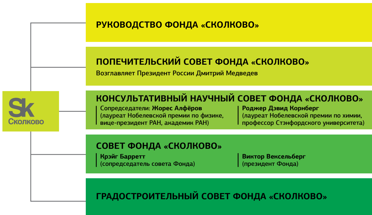
СХЕМА УПРАВЛЕНИЯ ФОНДОМ