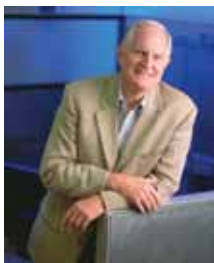
Крэйг Барретт Сопредседатель совета Фонда «Сколково»

Член бюро правления Российского союза промышленников и предпринимателей (РСПП), председатель комитета по международной деятельности РСПП. В марте 2010 года решением Президента РФ Д. А. Медведева был назначен руководителем российской части проекта по созданию инновационного центра в Сколково.